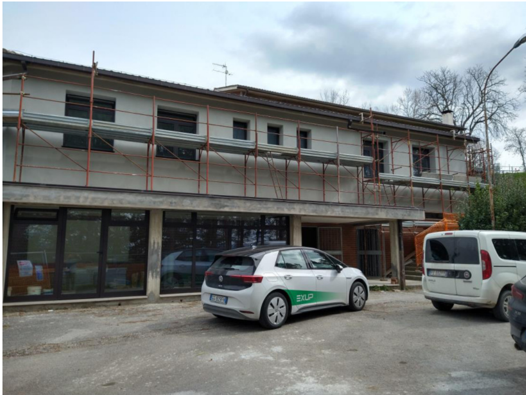
Punto di scatto 3