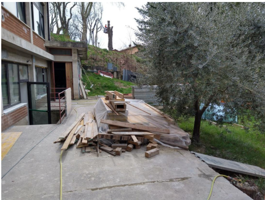
Punto di scatto 14