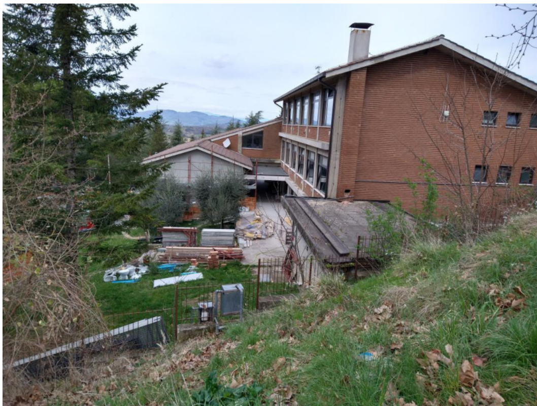
Punto di scatto 15