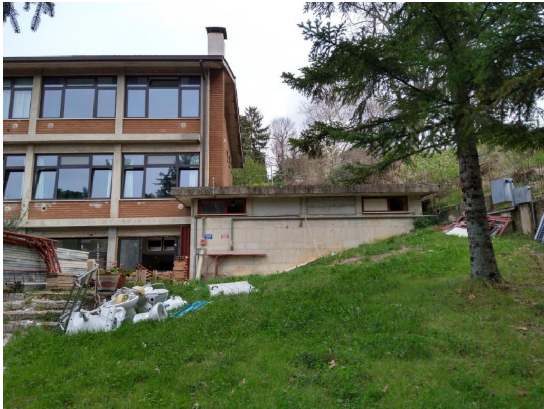
Punto di scatto 13