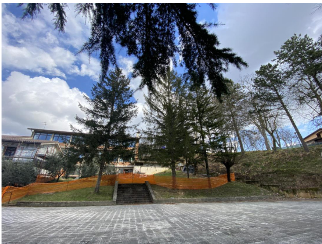
Punto di scatto 10