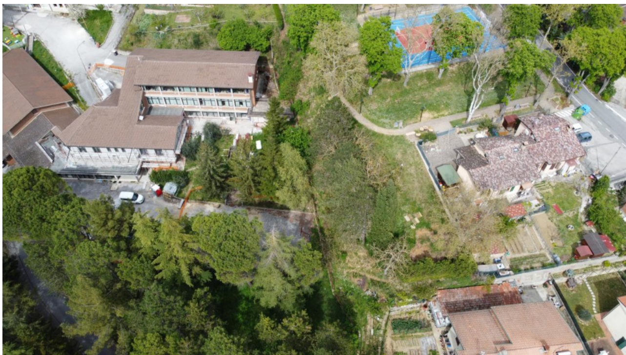
Foto drone 2