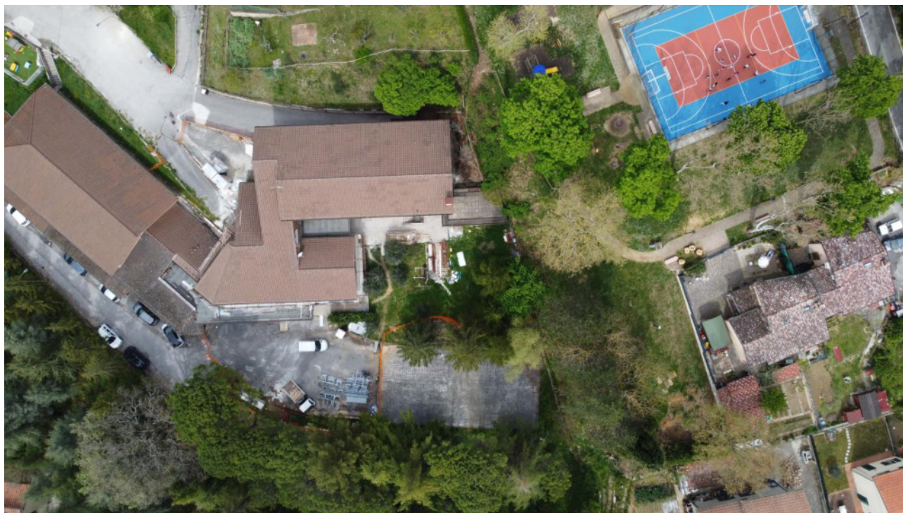
Foto drone 3