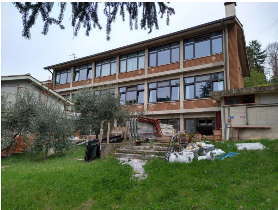
Punto di scatto 11