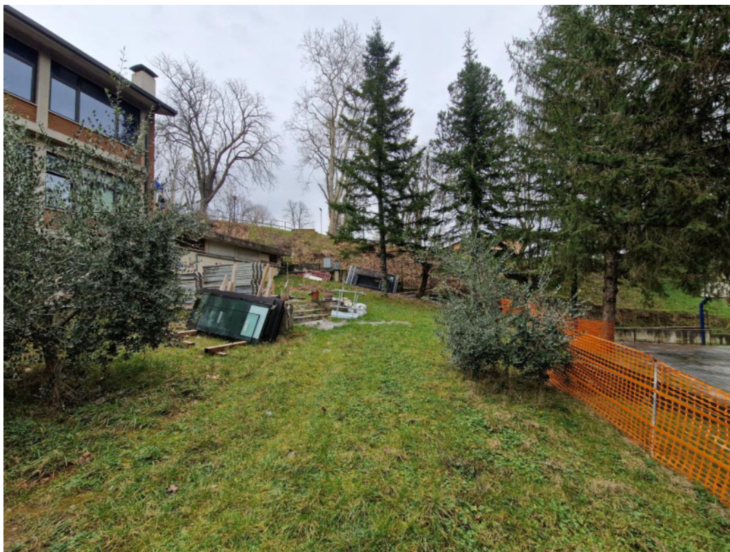
Punto di scatto 9