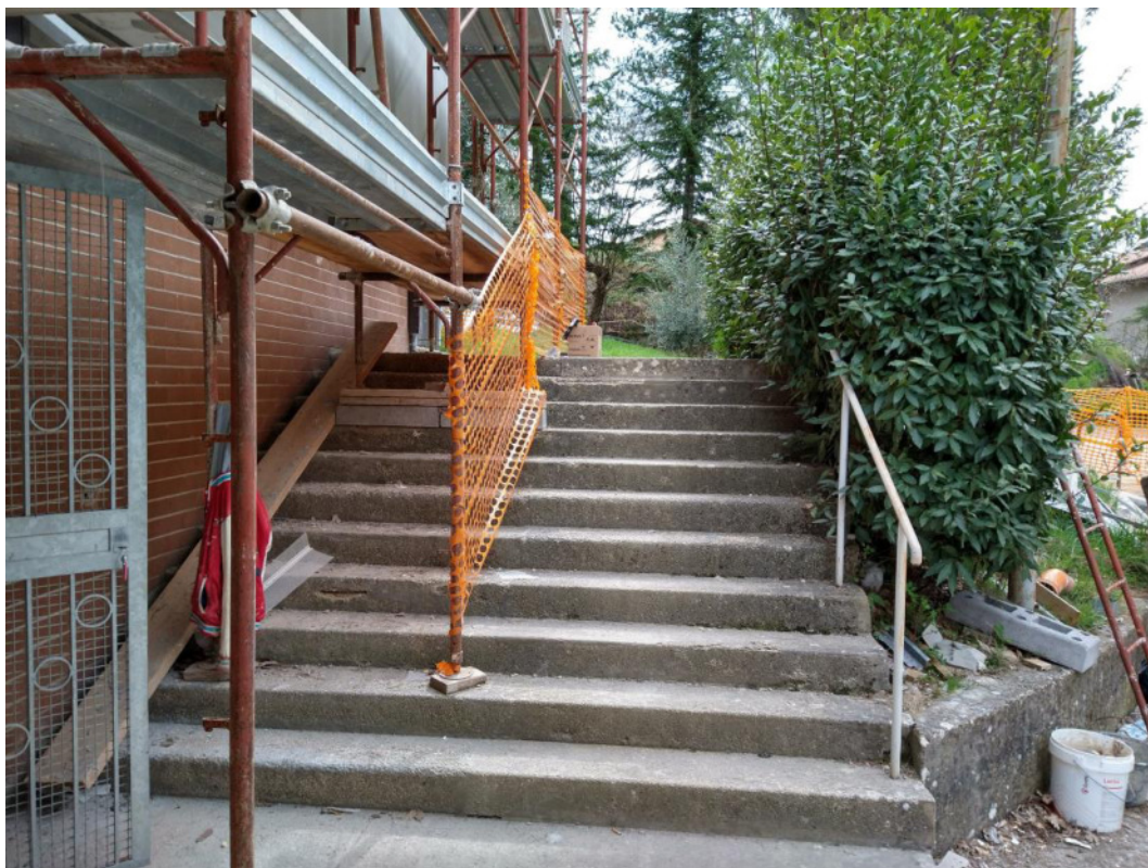
Punto di scatto 5