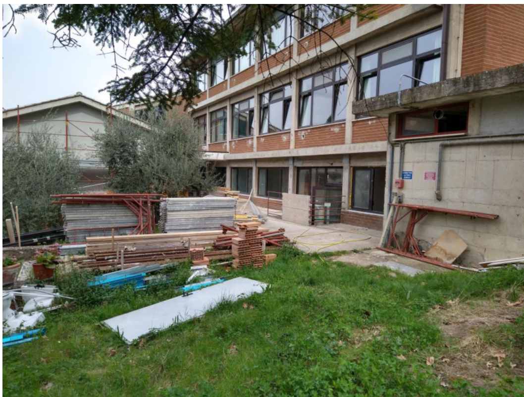
Punto di scatto 12