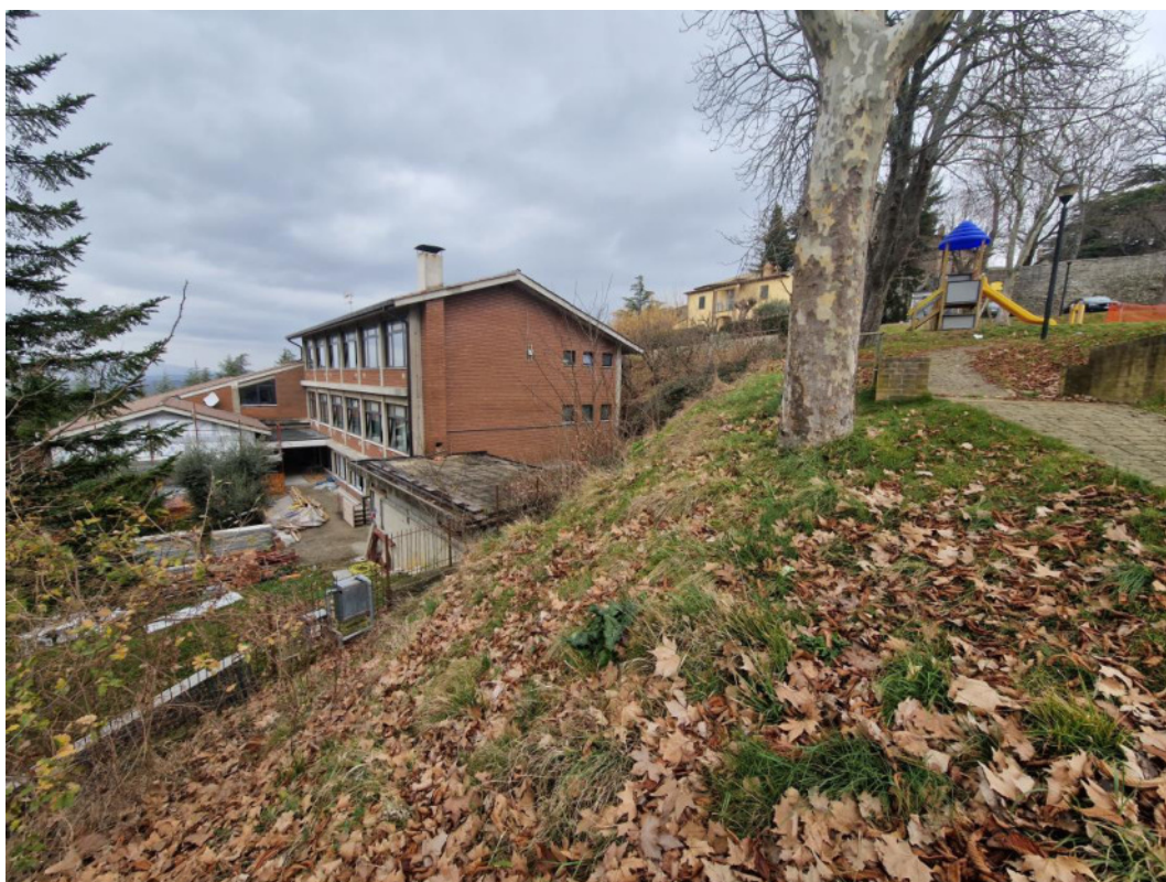
Punto di scatto 16