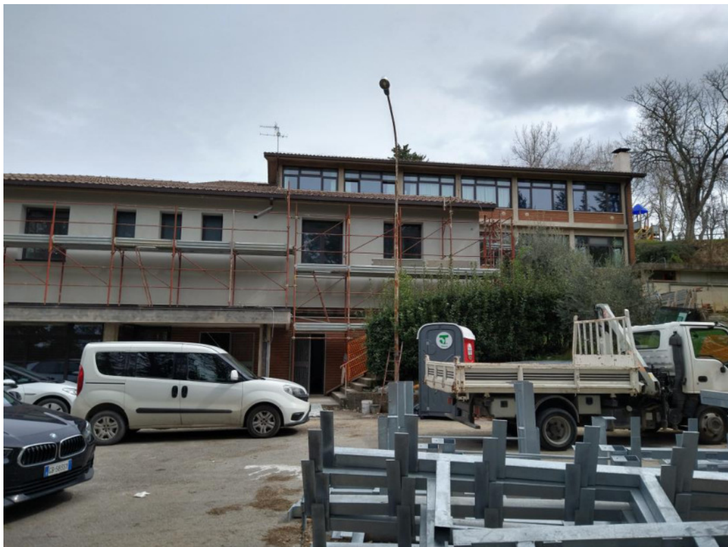
Punto di scatto 4