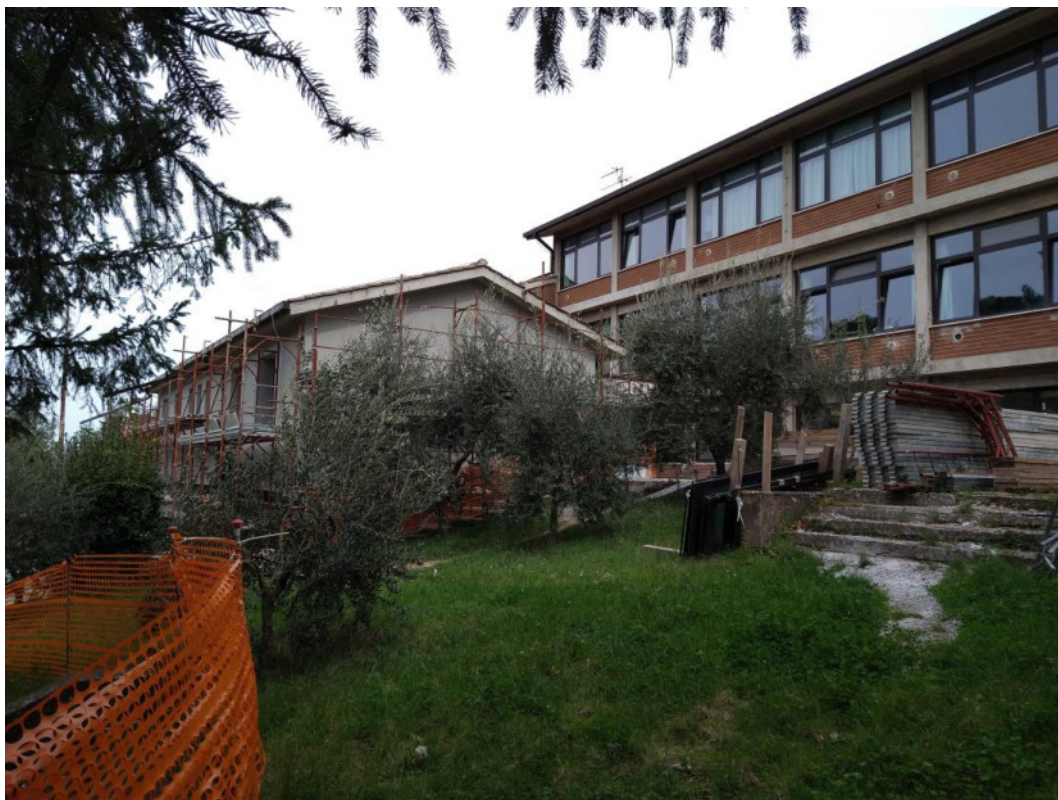
Punto di scatto 7