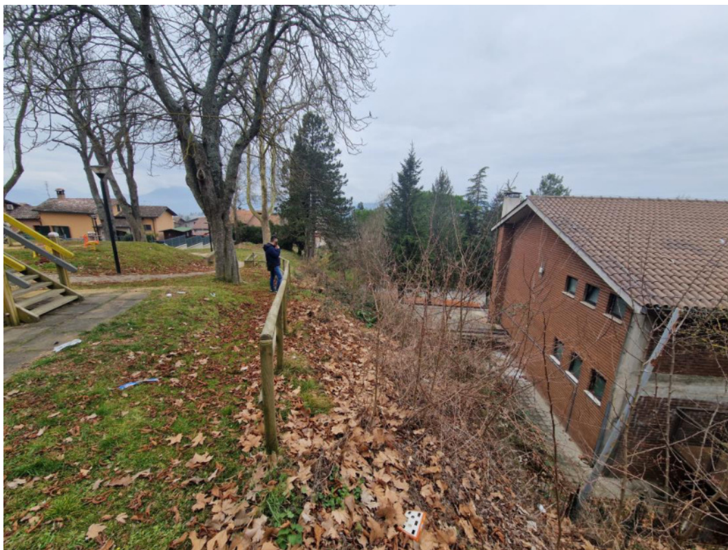
Punto di scatto 17