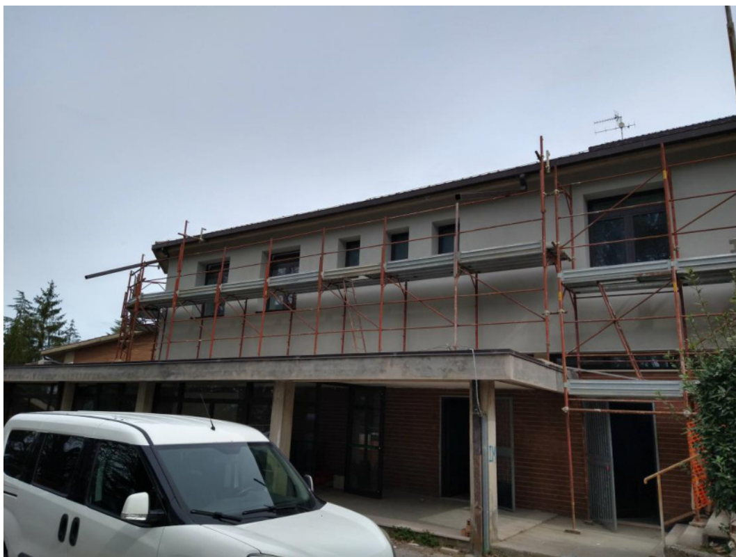
Punto di scatto 2