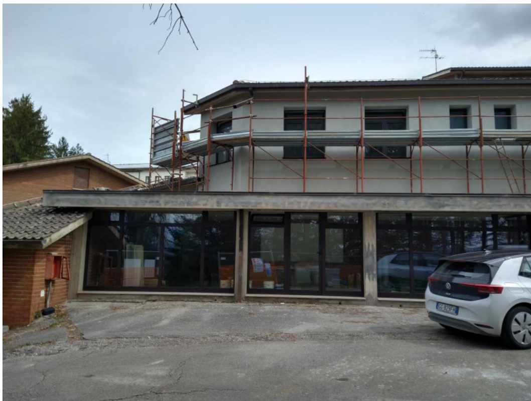
Punto di scatto 1