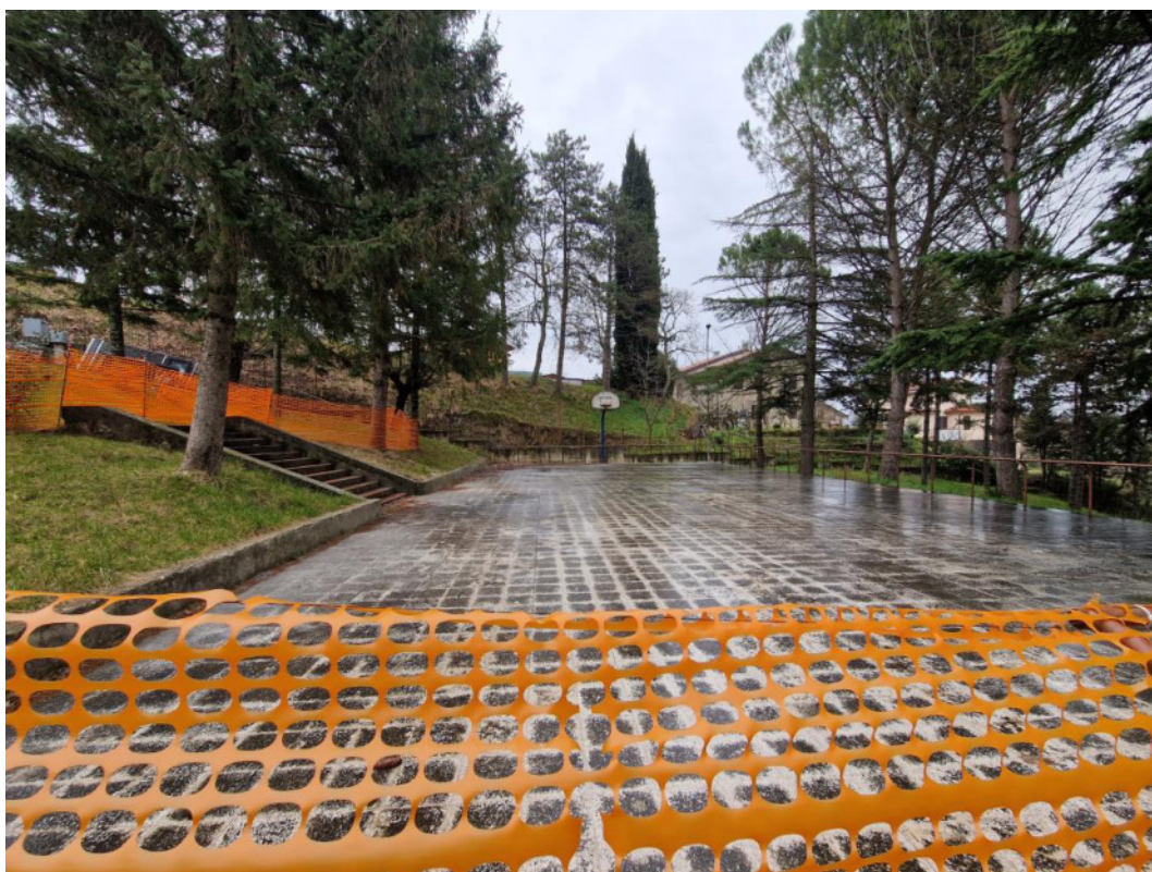
Punto di scatto 8