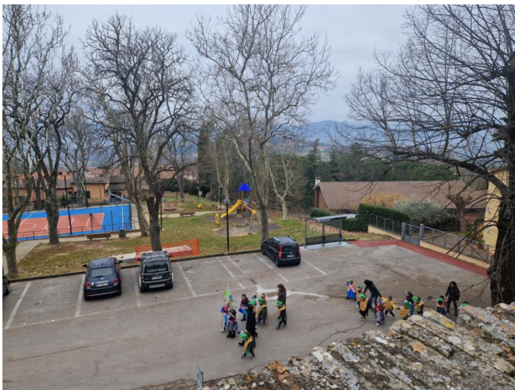
Punto di scatto 18