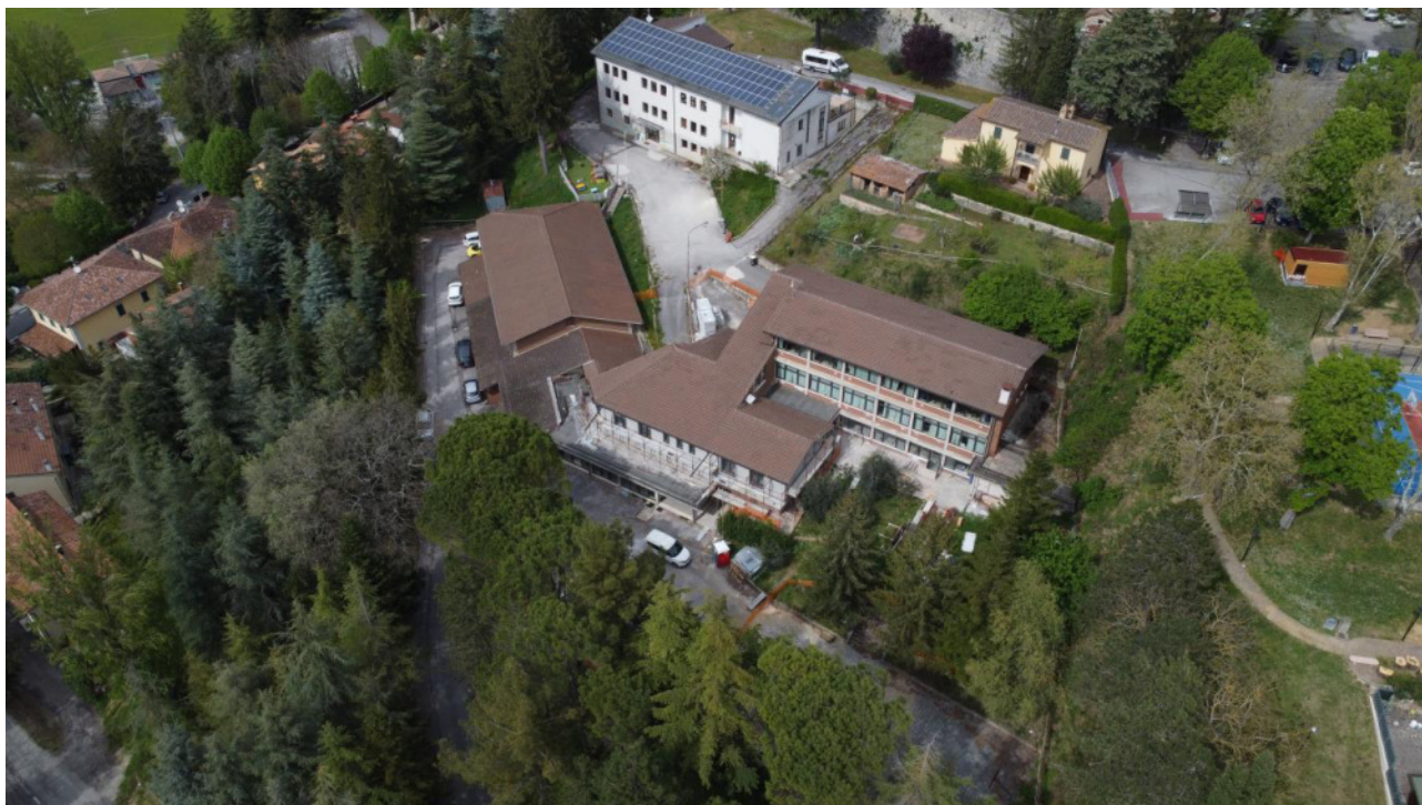
Foto drone 1