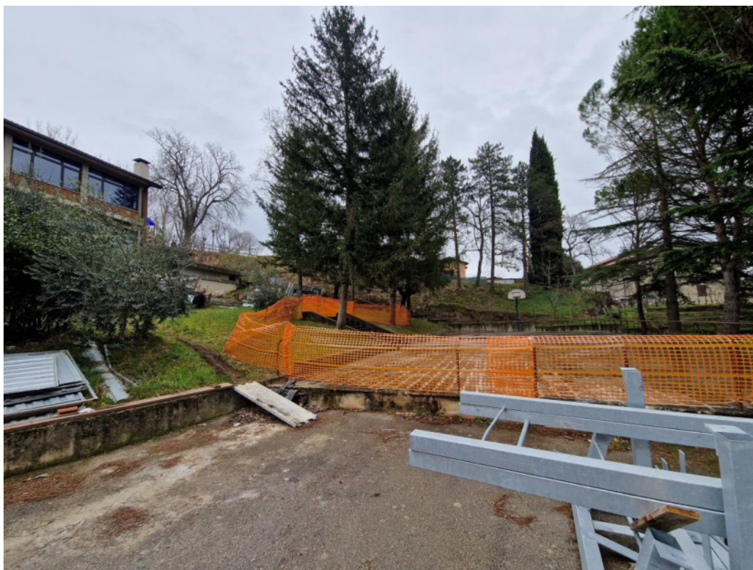
Punto di scatto 6